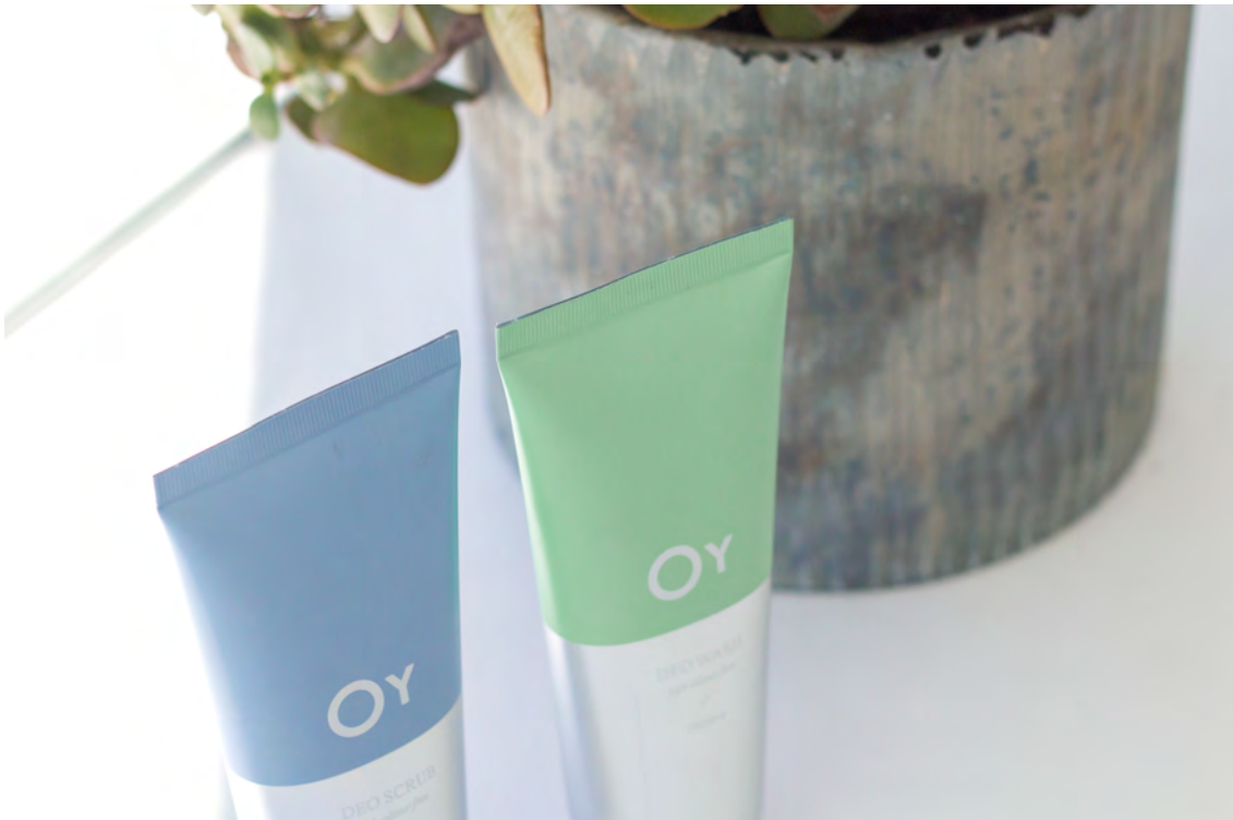
OY producten aan de wastafel.

En zo zag OY, Noors voor eiland , in mei 2018 het levenslicht. Gebotteld vertrouwen claimt de baseline, omdat je als gebruiker niet langer bezorgd moet zijn om een nare zweetgeur. Je zweet wel, maar geurt niet meer. De milde frisheid van je eigen naturel. Bovendien zijn de OY Care producten – in tegenstelling tot de meeste deo's - volledig biologisch afbreekbaar. Ook dat ecologische aspect zet OY graag in de kijker.