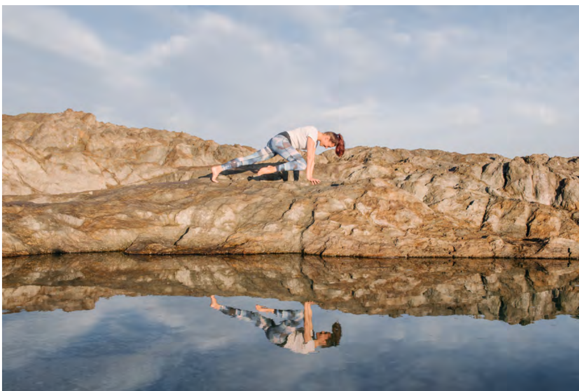
Ook geurloos na een stevige inspanning.

”Het neutraliseren van bacteriën en schimmels die slechte geur veroorzaken”, gaat ze enthousiast verder, “zorgt onder je oksels, tussen je tenen, in je lies voor een gezond evenwicht, een betere balans. OY staat voor geurloos zweten, voor een wereld van frisheid. Vanaf nu is het voor iedereen haalbaar om fris door het leven te stappen. Okselvijvers zijn dus opnieuw toegestaan zo lang je maar niemand stoort omdat je een onaangename geur verspreidt. Bovendien blijft je kledij ook langer fris. Eens je geurloze zweet is opgedroogd, ruiken je T-shirts niet meer.”